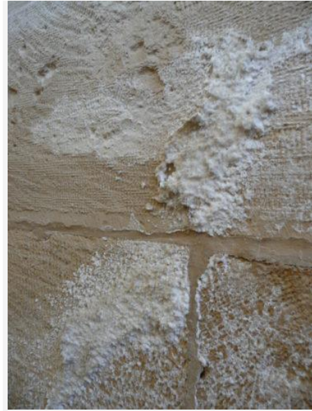
Efflorescence de surface