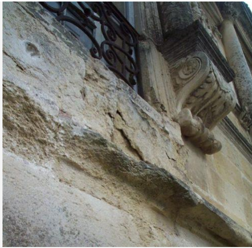
Desquamation par plaques